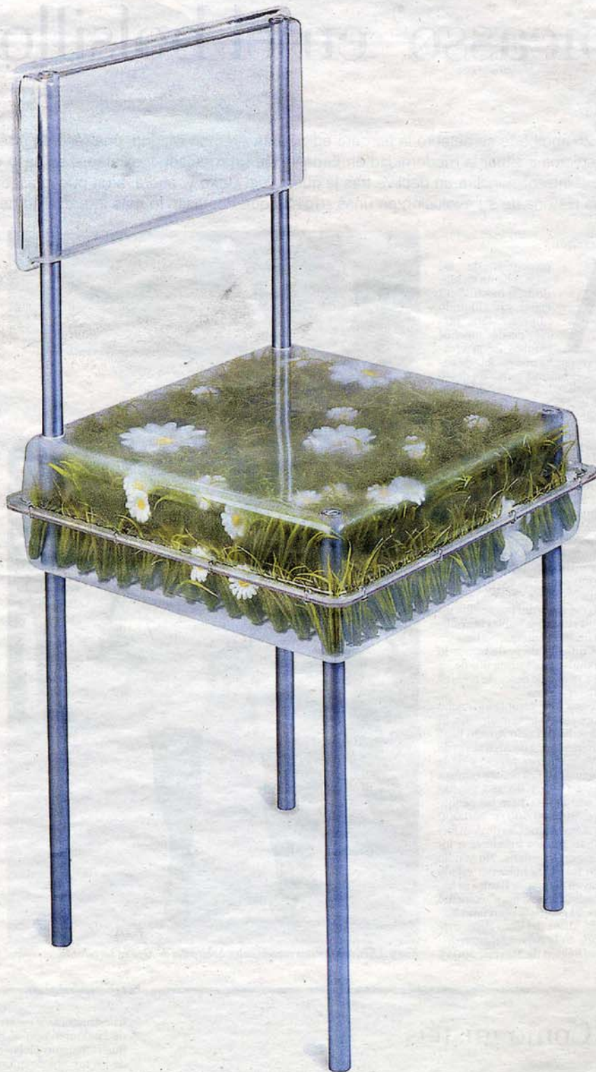
Silla diseñada por el estudio Walking Chair, en la exposición 'U. D. A. Últimos diseños austriacos', de la Fundación Canal.

EQUIPAJE DE BOLSILLO Nueva traducción de La tierra baldía , T. S. Eliot, las novedades de Chesterton y Umberto Eco, y una colección sobre clásicos del pensamiento. 28