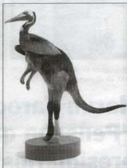
Obra de Thomas Grünfeld

La muestra, selección de sus conocidos Mistifs (Mixtificaciones o simplemente Mixtos), está integrada por varias piezas de taxidermia de diferentes especies animales, deliberadamente alterados, mutilados y recompuestos creando una increíble fauna mutante nacida de la imaginación del artista. Este subvertir el orden, traspasar la barrera de lo correcto, este infringir las leyes de la naturaleza para convertir lo normal en algo contrario a lo familiarmente aceptado, es un desafío a la creación que trata de hacernos reflexionar sobre el verdadero alcance de la fantasía y su versatilidad frente a la razón, la lógica, la supuesta armonía reinante en la naturaleza. Así, el absurdo se torna realidad que desconcierta y al mismo tiempo incita nuestra curiosidad hacia lo improbable. En la historia del arte así como en la literatura existen antecedentes a este respecto, ya sea a través de la ficción o de la realidad, con la finalidad de transgredir los dictados de la ciencia en aras del asombro ante la creación de seres binarios mediante la metamorfosis de sus partes. Quizá el caso más célebre sea el de Leonardo da Vinci, quien desde muy joven se sintió atraído por el juego con la naturaleza inventando seres horrendos y terroríficos a partir