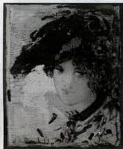
"CABEZA COLLAGE", técnica mixta, 46 x 38 cm

C/ Andrés Torrejón, 8 (Frente a la Real Fábrica de Tapices) 28014 Madrid • Tel. 91 501 78 91 • Fax 91 501 78 92 www.la-pinacoteca.com • info@la-pinacoteca.com