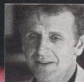
◀ MIJAIL BARYSHNIKOV

Comenzó a bailar a los nueve años en su Rusia natal y a fotografiar a los 40 en su América adoptiva. Para entonces, ya había posado para Irving Penn, Richard Avedon o Cartier-Bresson. Inspirado por ellos, se ha adentrado en la sensualidad del baile, como en esta imagen de la serie Dominican Moves , de 2006.