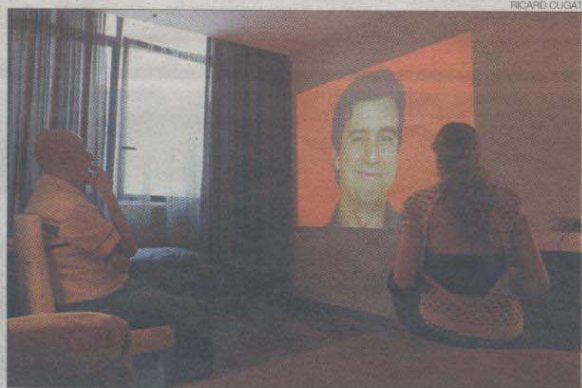
▶▶ Unos visitantes contemplan You and me , de Jean-Luc Vilmouth

ESTILO MUY POP // También se puede ver el vídeo del mediático juicio de O.J. Simpson en versión animación, hecho por el artista alemán Kota Ezawa. La obra de este artista consiste en trasladar imágenes reales a dibujos con un estilo muy pop. Es el mismo estilo que usó para las ilustraciones del vídeo de la luna de miel entre Pamela Anderson y Tom-