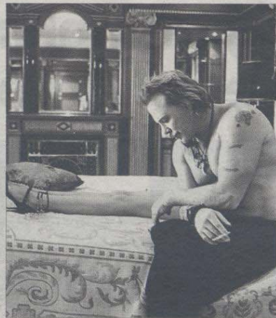
▶▶ Mickey Rourke acapara casi en exclusiva la atención del objetivo del cantante Bryan Adams.