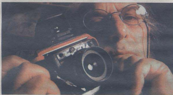
▶▶ El director de cine Carlos Saura, autorretratado, en una de las pocas imágenes en color que pueden verse en la exposición.

Los famosos están siempre bajo los focos, son observados constantemente. Pero a ellos también les gusta mirar. A la rutilante estrella de Hollywood -Richard Gere- y al circunspecto escritor del siglo XIX -Emile Zola o Víctor Hugo- les une una misma pasión: la fotografía. Los trabajos de 25 fotógrafos insospechados, que se exhiben en la Fundación Canal de Madrid, dentro del festival Photo España, muestran los objetos, personas y experiencias vitales que han considerado necesario plasmar en una imagen.