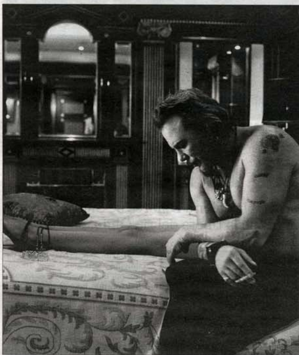
Mickey Rourke, visto a través de la cámara del cantante Bryan Adams.

mundo interior. De igual manera, el actor Richard Gere traslada su pasión por el Tibet a sus imágenes, y Lou Reed rinde su particular homenaje a Nueva York.