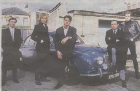
The Godfathers, en una imagen de la década de los ochenta.

Los legendarios The Godfathers , el grupo de rock obrero que vio nacer a las nuevas y crecidas generaciones del pop británico, se presenta esta noche en Madrid para celebrar la reedición de su álbum de debut, Hit by hit , que publicaron hace ya 21 años.