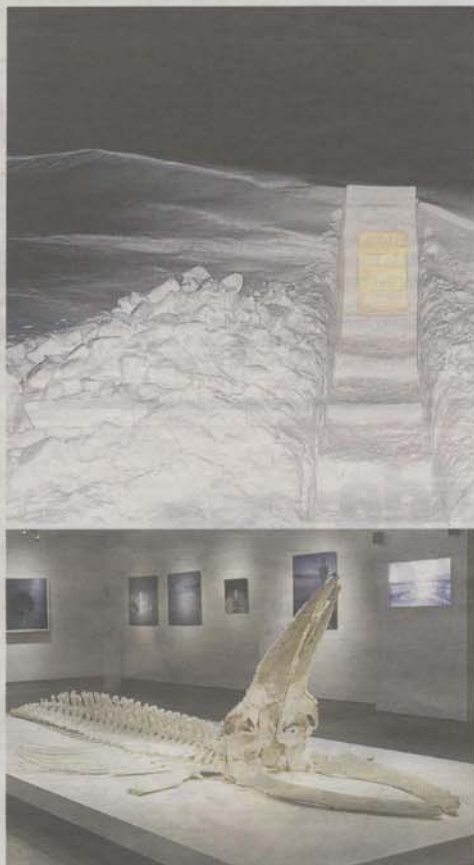
Dos obras de las 20 que conforman la exposición. FUNDACIÓN CANAL

☛ Fundación Canal: c/Mateo Inurria, 2. De 11 a 20 h. Gratis.