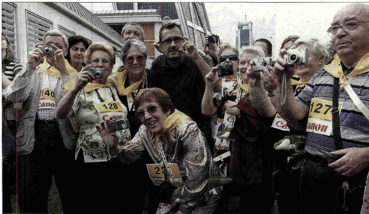
Participantes en la jornada fotográfica de captura.org, rodean a su promotor, el televisivo Andreu Buenafuente.