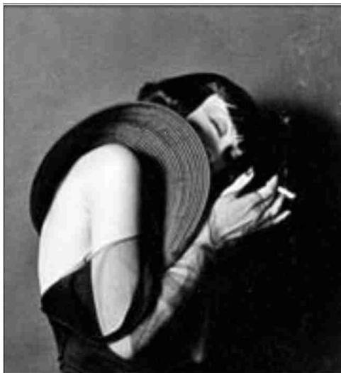
MARCUS LEATHERDALE. CORTESÍA M. LEATHERDALE FOUNDATION