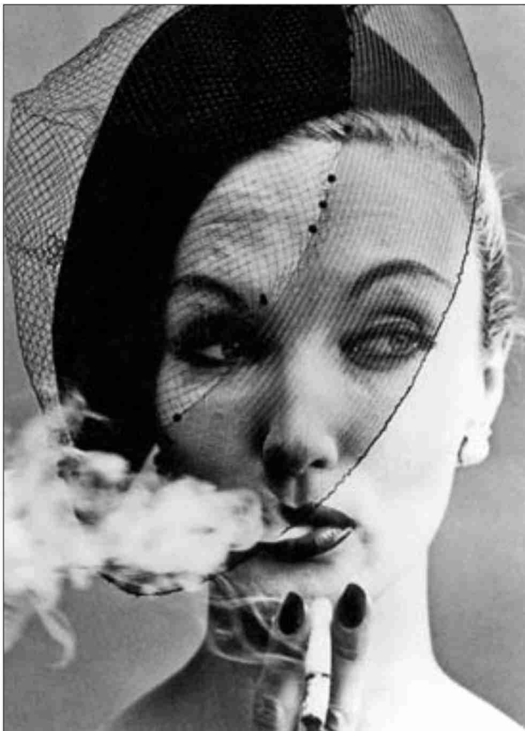
'Smoke &amp; veil'. París 1960.

► Horst P. Horst. Horst Paul Bohmann (más conocido como Horst P. Horst) es considerado por muchos como el creador de la fotografía de