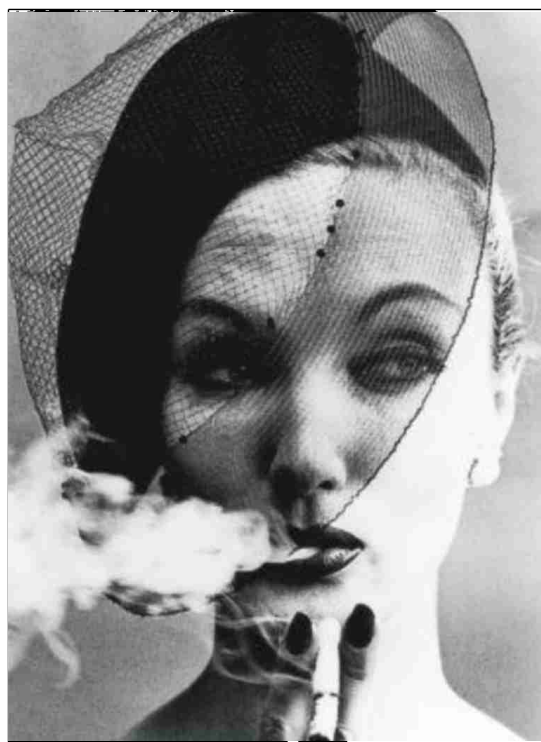
Velo y humo, de William Klein.