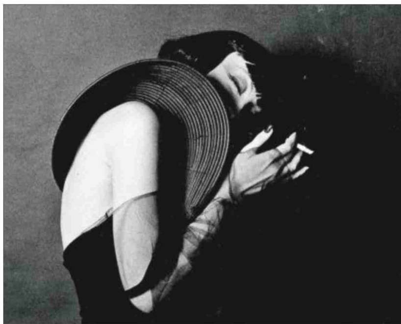
Retrato, de Marcus Leatherdale.

Mujeres en plural. Hasta el 4 de enero. De 11.00 a 20.00. Miércoles cerrado desde las 15.00. Entrada gratuita. Fundación Canal, Mateo Inurria, 2.