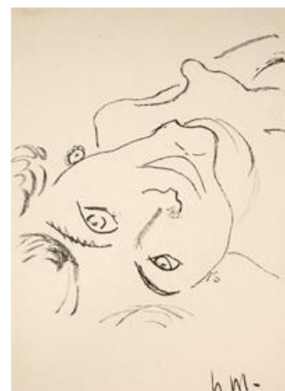
Cabeza invertida. 1906. © Succession H. Matisse, VEGAP,

Durante este período, Matisse trabajó con una misma modelo para producir una serie de quince litografías para las que utilizó una línea continua pura. En esta exposición se muestran dos de ellas. En conjunto, estas estampas ilustran el proceso de trabajo en serie a través del cual Matisse observaba y visualizaba a la modelo en el estudio. La modelo está relajada y su actitud es natural, ya que posa de una manera informal y personal, en lugar de la forma académica convencional. Observando los grabados, el espectador experimenta el paso del tiempo ya que cada pose de la modelo es capturada por las estampas como si fueran los fotogramas de una película, una pausa en un continuo de observación y transformación. A diferencia de lo que ocurría en las xilografías, en estas litografías las imágenes flotan sin bordes, delimitadas por las dimensiones del papel.