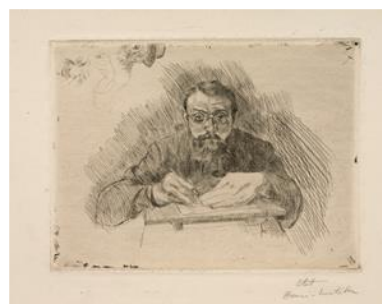
Henri Matisse grabando. 1900-03. © Succession H. Matisse, VEGAP, 2019

Al igual que muchos pintores anteriores a él, Matisse comenzó su exploración del grabado y la estampación a través de las técnicas del aguafuerte y el grabado a punta seca, al tratarse de las más fácilmente extrapolables desde la práctica del dibujo sobre el papel. En particular, para sus primeras estampas utilizó el grabado a punta seca. Esta técnica consiste en dibujar directamente sobre la placa matriz con una herramienta afilada que talla las líneas en el metal. En función de la fuerza con la que se aplica la herramienta, ésta desplaza una mayor o menor cantidad de metal creando un reborde llamado rebaba. Cuando la placa está entintada, las líneas con rebaba atrapan más tinta de modo que cuando se estampan, dicho reborde produce un relieve oscuro y algo difuso.