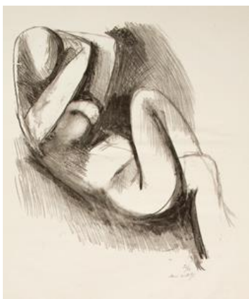
El gran desnudo. 1906.

Esta litografía es una excepción en la secuencia cronológica de la obra en grabado de Matisse, hasta tal punto de que compone por sí sola una sección en esta exposición. Es sorprendentemente abstracta y diferente de cualquier otro trabajo realizado por Matisse durante estos años. Hasta ese momento, Matisse realizaba las litografías por transferencia dibujando primero sobre papel para luego transferir la imagen a la piedra litográfica. Aquí, por primera vez, Matisse escogió trabajar directamente sobre la piedra litográfica para poder volver a la imagen, hacer revisiones, añadir y quitar, modelando literalmente la figura como si fuera una escultura.