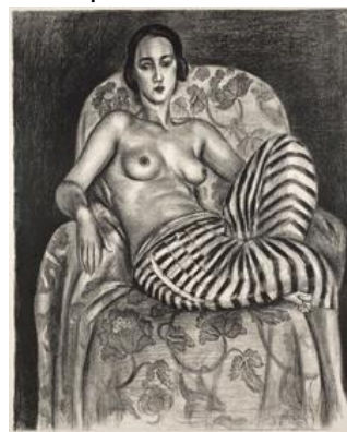
Gran odalisca con calzón de bayadera. 1925. © Succession H. Matisse, VEGAP, 2019

Al crear El Gran Desnudo Matisse se había centrado en la combinación de tonos para lograr un efecto escultórico. Ahora, dieciséis años más tarde con Modelo descansando , eligió trabajar de manera más pictórica, utilizando la luz como un medio para integrar la forma de la modelo retratada y el entramado decorativo del fondo. Muchos de los grabados de Matisse de este período están directamente relacionados con sus dibujos a carboncillo de la década de 1920. Si bien, existen similitudes entre las composiciones de grabados, dibujos y pinturas, hay diferencias importantes que demuestran que Matisse creó los grabados como obras de arte en sí mismos y no como meras reproducciones de sus cuadros.