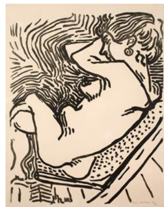
Gran xilografía, 1906 © Succession H. Matisse, VEGAP, 2019

Presentación a medios: 16 de mayo de 2019. 10 horas. Apertura al público: Del 17 de mayo al 18 de agosto de 2019