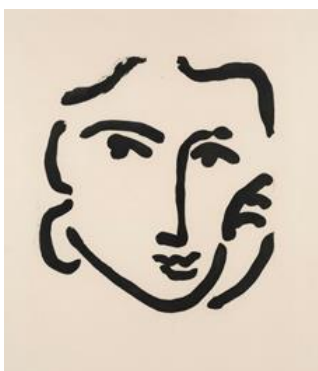
Nadia con expresión seria. 1948.

En 1943, para escapar de una posible invasión aliada de Niza, Matisse estableció su residencia en Vence, una ciudad montañosa próxima a la costa, donde permaneció hasta 1949. Allí, en 1946 y 1947, comenzó a hacer dibujos con pincel y tinta, en los que el marcado contraste de la tinta negra con el papel blanco alcanzó una intensidad gráfica que recuerda a sus dibujos a tinta y sus xilografías del periodo fauvista de 1906. Estos nuevos dibujos producen sensaciones tan fuertes como las logradas a base de contrastar colores vivos en las pinturas y los recortables que realizó en Vence. Matisse escribiría: "Los dibujos negros con pincel contienen, en reducido, los mismos elementos que las pinturas con color ... es decir, la diferenciación en las cualidades de la superficie unificada por la luz".