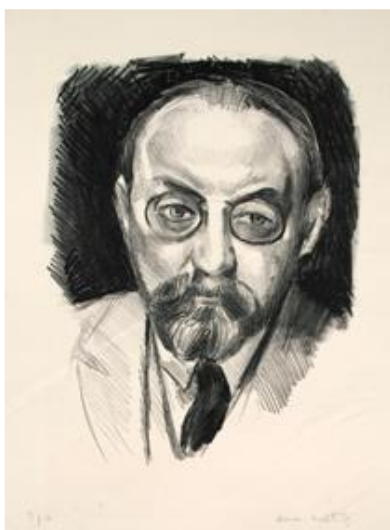
Autorretrato. 1923. © Succession H. Matisse, VEGAP, 2019

Henri Matisse (1869–1954) fue pintor, escultor, dibujante y grabador. Fue un artista profundamente comprometido con todas estas disciplinas creativas, y comprendió que cada una de ellas ofrecía posibilidades y retos únicos. La exposición “Matisse grabador. Obras de The Pierre and Tana Matisse Foundation” destaca su obra impresa, generalmente a la sombra de sus pinturas y esculturas más celebradas, y revela su merecido brillo como obras de arte.