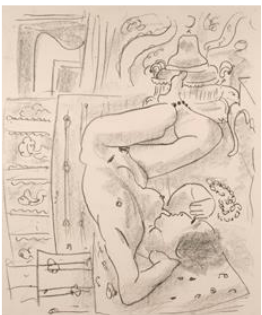
Desnudo invertido con brasero. 1929. © Succession H. Matisse, VEGAP, 2019

Entre 1917 y 1925 Matisse produjo pocos aguafuertes y grabados a punta seca, pero después de 1926 su producción aumentó notablemente. Su tema principal fue la "Odalisca", mencionadas anteriormente en la sección 6. Aunque estas figuras rememoran sus viajes a Marruecos en 1912 y 1913, las odaliscas que observó y dibujó en su estudio en Niza eran modelos. Vestidas con pantalones y blusas del norte de África, pero con mayor frecuencia desnudas, Matisse dibuja a sus odaliscas a través de una línea libre que entreteje sus formas en ricos interiores de sillas tapizadas, alfombras estampadas y paredes cubiertas con telas decorativas. Algunas piezas ocasionales de muebles moriscos proporcionan un adorno complementario. En estudios llenos de luz donde las sombras no existen, estas mujeres parecen