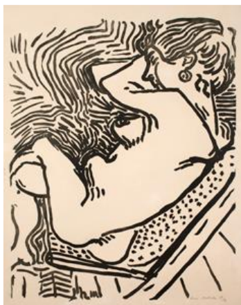
Gran xilografía. 1906. © Succession H. Matisse, VEGAP, 2019

La época en la que trabajaba en su gran lienzo La alegría de vivir , fue para Matisse una época muy activa en el campo de la estampación y publicó tres xilografías (grabados en madera) muy llamativas y una serie de litografías. Muchos de esos grabados se incluyeron en su segunda exposición individual en 1906, que coincidió con el Salon des Indépendants, donde La alegría de vivir estaba siendo exhibida. Matisse sintió que era importante mostrar de forma conjunta sus pinturas, esculturas, dibujos y grabados, ya que cada medio revelaba un enfoque diferente pero equivalente de la evolución de su visión artística.