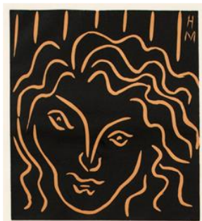
Cabeza de mujer, mascarón. 1938. © Succession H. Matisse, VEGAP, 2019

En alguno de sus linograbados, Matisse introduce el color. Para ello, el papel se imprime en primer lugar con una tinta de color naranja claro antes de aplicar el negro. Gracias a este proceso, las líneas toman el color naranja en lugar del blanco en las zonas de papel no impreso, resonando armónicamente con el campo negro circundante. El efecto es diametralmente diferente a los linograbados sin color, donde las líneas blancas y brillantes se leen con una marcada claridad contra el negro.