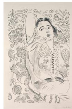
Arabesco. 1924. © Succession H. Matisse, VEGAP, 2019

Al mismo tiempo que Matisse se enfrentaba a nuevos desafíos en la creación de litografías tonales, continuó dibujando los desnudos reclinados de modo lineal. Su serie Estudio de piernas registra una sesión un tanto lúdica en la que estudiaba diferentes posturas de las piernas de su modelo. Las figuras llenan la hoja de papel por completo, generalmente con la cabeza o un pie recortados en los bordes. Al igual que el artista transformó en grabados los dibujos de estudio en 1906 y 1913, en esta ocasión volvía a utilizar la estampa como forma de dar a conocer al espectador el trabajo que hacía en el estudio. Cuando un dibujo estaba completo y era considerado apto, el artista lo entregaba al litógrafo quien situaba el papel en la prensa para transferir el dibujo a crayón a la piedra litográfica.