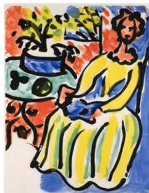
Marie-José con vestido amarillo (III). 1950. © Succession H. Matisse, VEGAP,

Marie-José con un vestido amarillo es el único grabado a color de Matisse, aparte de la aguatinta a color de 1935 La Danza y los realizados para libros ilustrados. La estampa está relacionada con su pintura de 1947 Mujer joven de verde en interior rojo . Aquí se muestran tres impresiones: la primera, en negro, que muestra el dibujo a pincel; la segunda, con trazos de rojo y amarillo añadidos; y la estampa final terminada, con la incorporación del azul y del verde. La aplicación de cada color requería placas separadas, y su complicada técnica sugiere la colaboración de un maestro estampador. Pese a lo atractivo de su resultado, resulta sorprendente que a esas alturas de su trayectoria Matisse emprendiera este reto de un estampado en color. La fuerza de la versión en negro corrobora que en el grabado y en el dibujo, Matisse podría articular sus ideas en un lenguaje en blanco y negro; el color es superfluo.