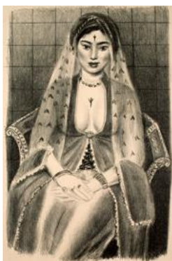
La persa. 1929. © Succession H. Matisse, VEGAP, 2019

En las grandes litografías de odaliscas sentadas de 1925, Matisse utilizó la luz para resaltar los cuerpos en la oscuridad circundante y los intensos estampados que cubren los asientos sobre los que posa la modelo. La figura adquiere una nueva monumentalidad que se asocia al trabajo que Matisse realizaba de forma simultánea en escultura, como por ejemplo en Gran desnudo reclinado .