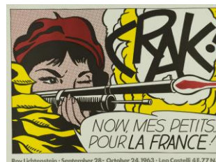
De izq. a dch...: Crying girl, 1963; Brushstroke, 1965 y Crak!, 1963