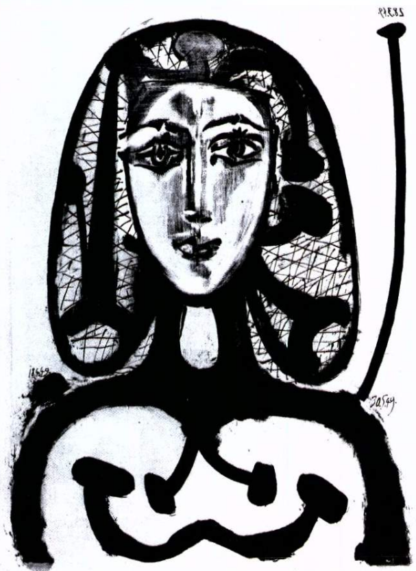
Françoise Gilot, dibujo.